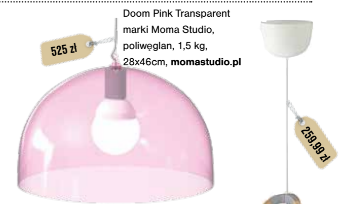
Doom Pink Transparent marki Moma Studio, poliwęglan, 1,5 kg, 28x46cm, momastudio.pl

Ciemny fiolet jest mocnym kolorem, ale w towarzystwie bieli i w jasnym pokoju bardzo dobrze się sprawdza. Filcowy kot marki Lilyshop jest dodatkowym siedziskiem (ze sklepu Walma dla domu – tylko polski design).