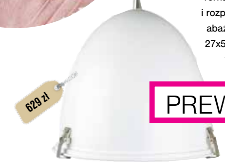
Torna, daje skupione i rozproszone światło, abażur z tworzywa, 27x56 cm, dł. kabla: 1,4 m, IKEA